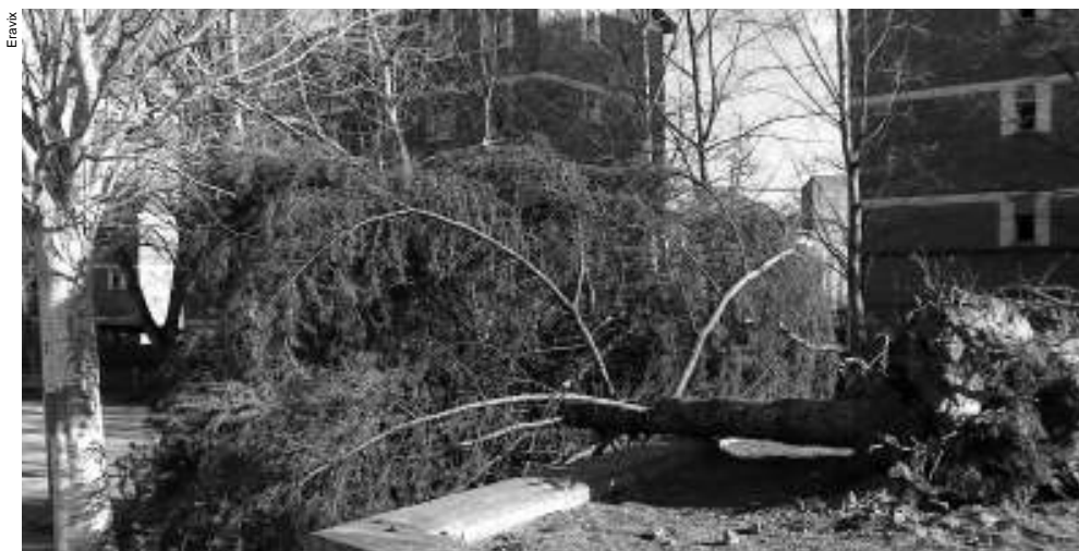
Arbres tombats. Plaça Joan XXIII, a Buenos Aires (dalt) i entre el passeig de Catalunya i la plaça dels Vents (sota)