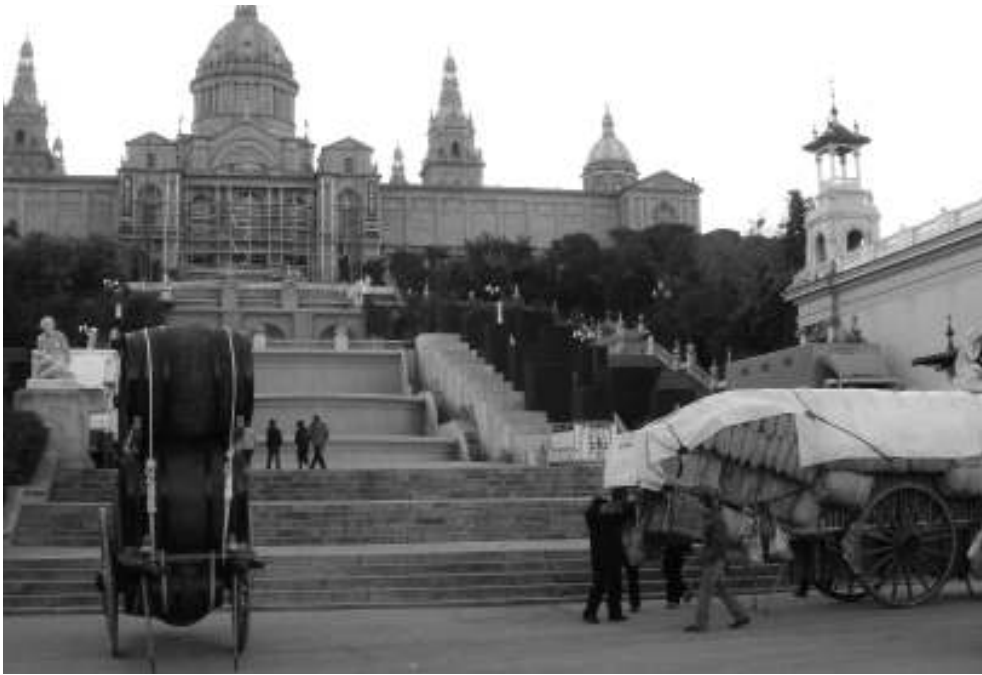
Els carros de Martorell. Els Amics de Sant Antoni Abat, davant de les fonts de Montjuïc, participant a Barcelona

■ El 24 de gener passat els Amics de Sant Antoni Abat van participar en els Tres Tombs de Barcelona que s'emmarquen dins les festes del barri de Sant Antoni. Malgrat que el fort vent no va acompanyar, ni va facilitar la desfilada aquesta va ser prou lluïda, molts barcelonins i també nombrosos turistes van poder gaudir de la presència dels nostres carros (el de les botes i el carro de fàbrica), que van ser força comentats, admirats i aplaudits per als assistents. Aquells que hi vam participar, vam quedar força satisfets d'haver representat la nostra població en aquest esdeveniment, una ex-