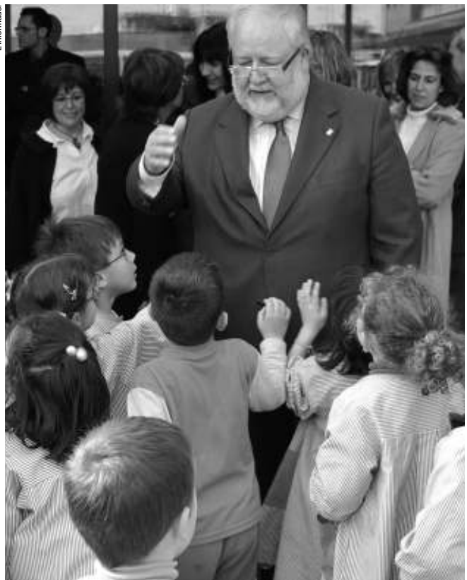
Els petits, ben vius. Els crits 'd'alcalde, alcalde' van ser l'anècdota del dia

En aquest sentit, el conseller Maragall va qualificar el CEE Mare de Déu del Pontarró "de referència de país" ja que "disposa de les últimes capacitats de desenvolupament en tecnologia i tècniques pedagògiques". Maragall va apuntar que "té el valor afegit de ser una escola per a les altres escoles". Mentrestant, Salvador Esteve va assegurar que "amb aquests centres educatius volem que la diferència es vegi com una casa assumible a la societat".