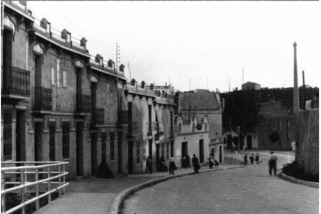
ota aquella altre peira de casa de... Carrer Meridional, any 1909.